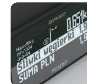
Graficzne wyświetlacze obsługi i klienta

Funkcja programowania przypomnień pozwala, aby użytkownik sam zdecydował, o czym kasa ma pamiętać. We wskazanym czasie urządzenie wydrukuje i wyświetli komunikat i przypomni o ważnej sprawie np. konieczności wykonania raportu miesięcznego, dniu płatności podatku czy urodzinach kierowniczk.