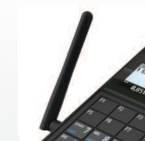
Dodatkowe interfejsy komunikacji bezprzewodowej