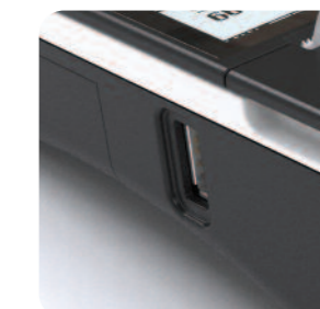
Archiwizacja danych na pendrive, obsługa skanera USB i szuflady