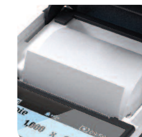
Łatwa wymiana papieru „drop in - wrzuć i drukuj”